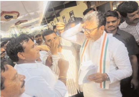
పెద్దపల్లి ప్రతినిధి, అట్లన్ సమాచార, 06 మే 2026