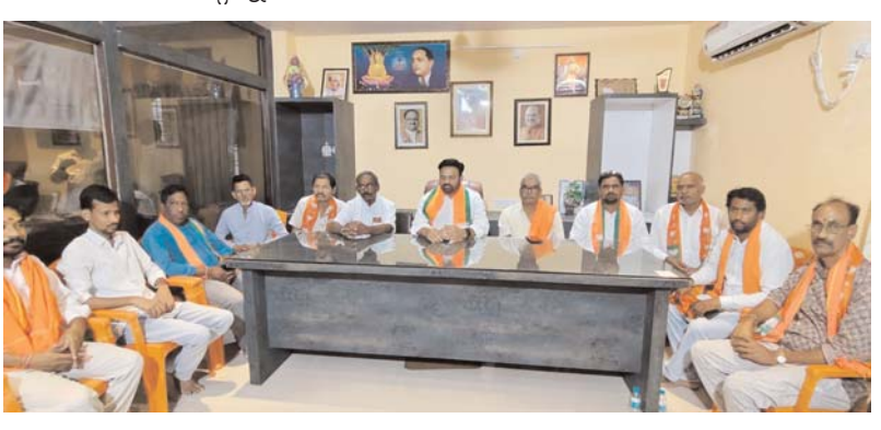
పెద్దపల్లి ప్రతినిధి, అట్లన్ సమాచార, 06 మే 2026