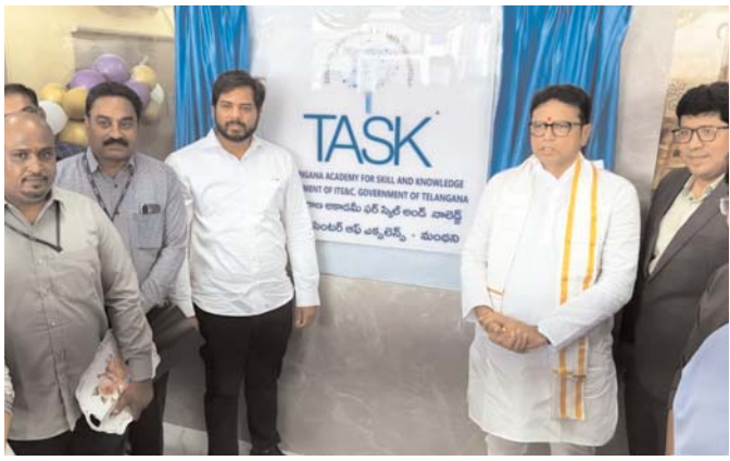
ప్రపంచానికి గ్రామీణ యువతను దగ్గర చేయడమే ప్రధాన లక్ష్యమని అన్నారు. ఇప్పటివరకు కృత్రిమ మేధస్సు వంటి

మంధని గ్రామీణ యువతకు ఆధునిక సాంకేతిక నైపుణ్యాల అందించాలనే లక్ష్యంతో మంధనిలో టాస్క్--ఏవీజీసీ ౧ కృత్రిమ మేధస్సు కేంద్రం, టాస్క్--సీటీఎల్ఎస్ ప్రతిభా కేంద్రం ఘనంగా ప్రారంభమయ్యాయి. కార్యక్రమంలో పెద్దపల్లి ఎంపీ గడ్డం వంశీకృష్ణ, రాష్ట్ర బడి శాఖ మంత్రి దుద్దిళ్ల శ్రీధర్ బాబు పాల్గొని కేంద్రాలను ప్రారంభించారు. ఈ సందర్భంగా వారు మాట్లాడుతూ అనిమేషన్, దృశ్య ప్రభావాలు, గేమింగ్, కామిక్స్, కృత్రిమ మేధస్సు వంటి ఆధునిక రంగాల్లో శిక్షణ పొందితే యువతకు విస్తృత ఉపాధి అవకాశాలు లభిస్తాయని పేర్కొన్నారు. గ్రామీణ విద్యార్థులు కూడా ప్రపంచ స్థాయి సాంకేతిక పరిజ్ఞానాన్ని నేర్చుకునే వేదికగా ఈ కేంద్రాలు ఉపయోగపడతాయని తెలిపారు. సంయుక్తంగా ఏర్పాటు చేసిన ఈ ప్రతిభా కేంద్రం ద్వారా పరిశ్రమ అవసరాలకు అనుగుణమైన శిక్షణ అందుతుందని వివరించారు. డి.జి.బిల్