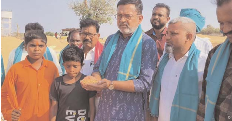
పెద్దపల్లి ప్రతినిధి, అట్లన్ సమాచార, 06 మే 2026

కొనుగోళ్లు ప్రారంభం కాకపోతే రోడ్డు దిగ్బంధం హెచ్చరిక