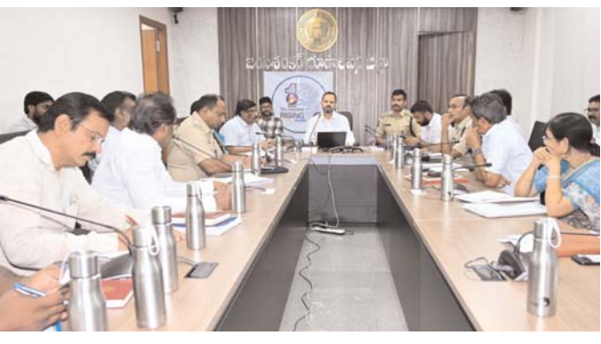
సూచించారు. ఎండలో బయటికి వెళ్లబప్పుడు కళ్లకు సస్ గ్లాసెస్, తలకు టోపీ లేదా కాటన్ గుడ్డ ధరించాలని, వేడి వాతావరణంలో పని చేసే వారు ప్రతి 20 నిమిషాలకు ఒకసారి ఐదు నిమిషాలు నీడలో విశ్రాంతి తీసుకోవాలని తెలిపారు. ఆహారంలో ప్రవహించే ఎక్కువగా ఉండేలా చూసుకోవాలని, కారం మసాలాలు తగ్గించాలని సూచించారు. ప్రయాణాల సమయంలో ఎలక్ట్రాలైట్ ద్రావణాలు తీసుకోవడం

పెరుగుతున్న ఎండల తీవ్రత దృష్ట్యా ప్రజలు ఆరోగ్యం పట్ల అప్రమత్తంగా ఉండాలని జిల్లా కలెక్టర్ రాహుల్ శర్మ సూచించారు. వేసవి కాలంలో వడదెబ్బ ప్రమాదకరమని, తగిన జాగ్రత్తలు పాటించడం ద్వారా దాని నుంచి రక్షణ పొందవచ్చని తెలిపారు. ప్రత్యేకించి చిన్నారులు, వృద్ధులు, గర్భిణీలు, దీర్ఘకాలిక వ్యాధులతో బాధపడుతున్న వారు, గుండె తదితర వ్యాధులు ఉన్నవారు మరియు కూలీలు మరియు జాగ్రత్తలు తీసుకోవాలని సూచించారు. ప్రజల ప్రాణ రక్షణ అత్యంత ప్రాధాన్యమని పేర్కొన్నారు. వేసవిలో డీహైడ్రేషన్ సమస్య అధికంగా ఉంటుందని, రోజుకు కనీసం 12--15 గ్లాసుల నీరు త్రాగాలని తెలిపారు. ఎండ తీవ్రత ఎక్కువగా ఉన్న సమయంలో బయటికి వెళ్లకుండా నీడలో ఉండాలని, అవసరమైతే ఉదయం 11 గంటల లోపు లేదా సాయంత్రం 4 తర్వాత మాత్రమే బయటకు వెళ్లాలని సూచించారు. గుండె, తలనొప్పి, తలనొప్పి, మూత్రపిండ సంబంధిత సమస్యలు ఉన్నవారు త్వరగా డి.హైడ్రేషన్ గుర్రయ్యే అవకాశం ఉందని, వీరు ప్రత్యేక జాగ్రత్తలు తీసుకోవాలని తెలిపారు. అల్ట్రాలో, సిగరెట్లు, కార్బోనెటెడ్ పానీయాలను దూరంగా ఉంచాలని